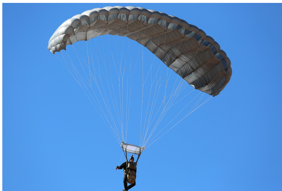
Voilure de réserve Hi-5 370™