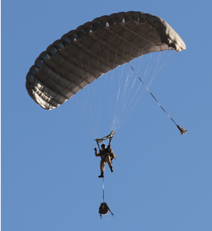
المظلة الرئيسية Hi-5 370™