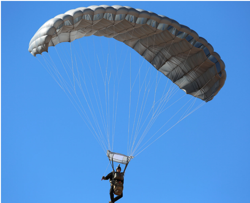
المظلة الاحتياطية Hi-5 370™

تعتبر مظلة Hi-5 370™ هي آخر مظلة للسقوط الحر من Airborne Systems صممت خصيصًا لمهام HAHO، رغم أنها أيضًا مناسبة لمهام HALO. ولقد كان مفهوم التصميم هو سد الفجوة بين مظلات Intruder 360 ومظلات Hi-Glide 380 مع إضافة خيار جديد إلى عائلة RA-1 لأنظمة المظلات. ويعتمد التصميم الجديد على خصائص التحكم في النظام Intruder، وخصائص الأداء في النظام Hi-Glide، ويجمع بين الاعتبارات التكتيكية لتصميم النظام الحقيقي للمظلة التكتيكية 'رئيسية على رئيسية' (المظلة الرئيسية والاحتياطية متشابهتان في أداء الطيران).