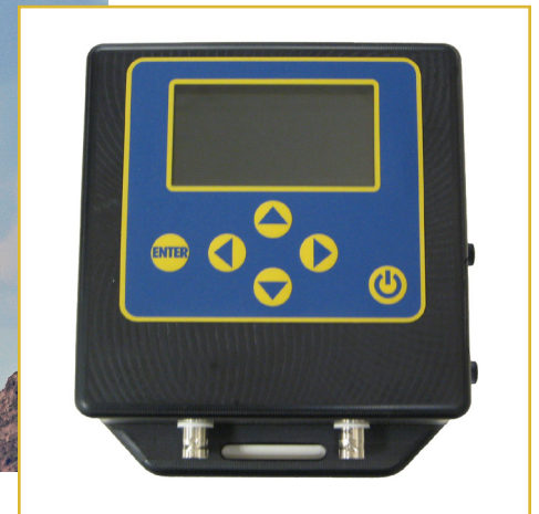
Unidad de control remoto