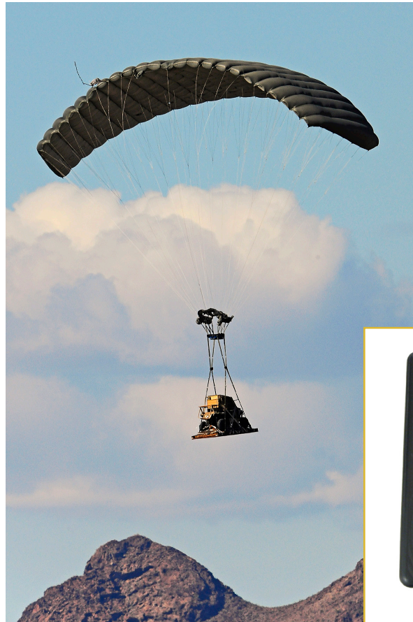
Système RazorFly™ transportant un véhicule Polaris MRZR4.

La planification s'effectue avec le planificateur d'Airborne Systems nommé jTrax Mission Planner. Ce logiciel calcule la zone de largage possible du système en utilisant des prévisions de vent et les caractéristiques de vol du RazorFly™. Le planificateur d'Airborne Systems jTrax Mission est également capable de simuler la trajectoire du système et de superposer ce vol sur des outils cartographiques 3D. Un outil de simulation permet aux utilisateurs de s'assurer de l'absence de collision possible entre le système et le terrain environnant.