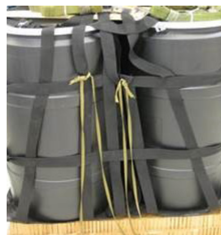
Cargo container slings